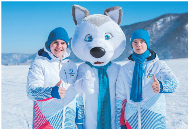
Штаб Зимней универсиады