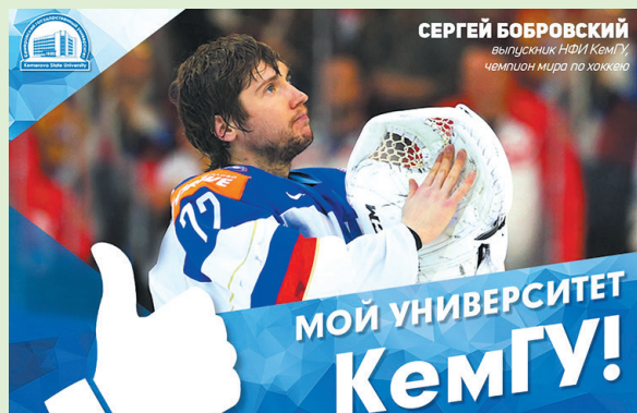
СЕРГЕЙ БОБРОВСКИЙ Выпускник НФИ КемГУ, чемпион мира по хоккею

В Новокузнецке состоялись праздничные мероприятия, посвященные 40-летию факультета физической культуры НФИ КемГУ.