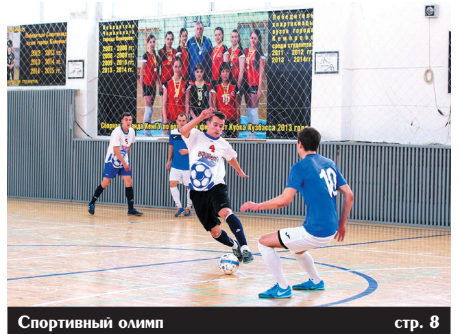
Спортивный олимп стр. 8

Лауреат губернаторской премии «Молодость Кузбасса» Победитель Всероссийского конкурса журналистов «Золотой гонг - 2013»