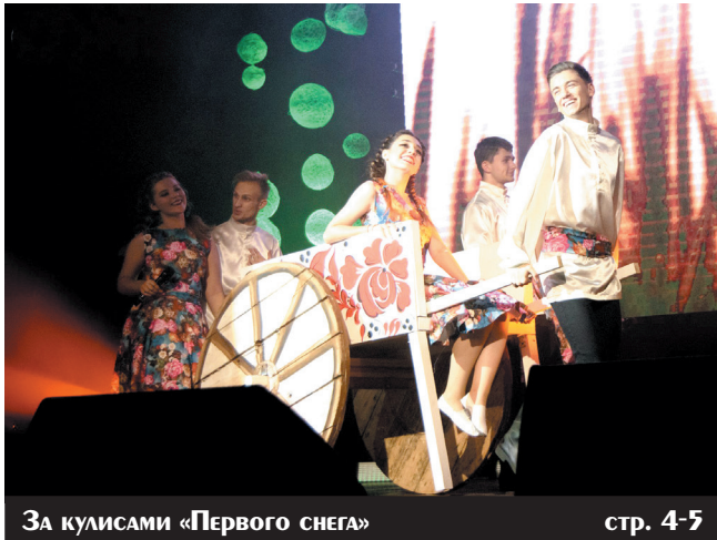
За кулисами «Первого снега» стр. 4-5