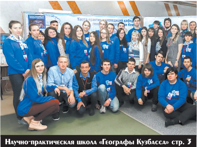
Научно-практическая школа «Географы Кузбасса» стр. 3