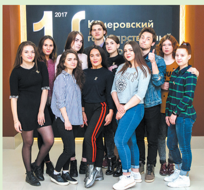
Отдел информации и связей с общественностью КемГУ.

у ребят получается не все и не сразу, но они пробуют, экспериментируют, включают одни идеи, отработывают другие. Тем более что и технические возможности в вузе мощные: есть современный медиасервис, есть специалисты, которые помогают студентам стать настоящими журналистами.