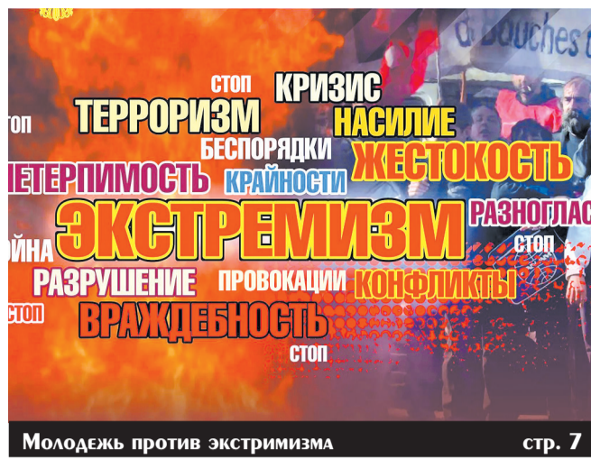
Молодежь против экстримизма