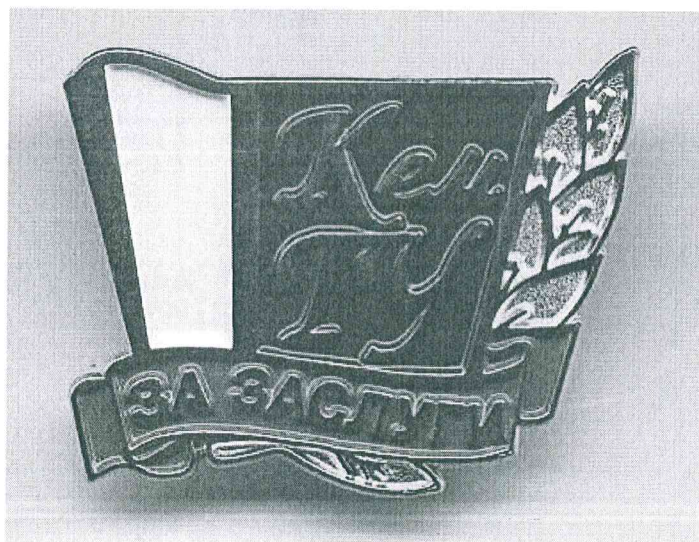
Иллюстрация. Знак «За заслуги перед КемГУ»