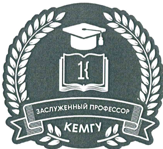
Иллюстрация. Почетный знак «Заслуженный профессор КемГУ»